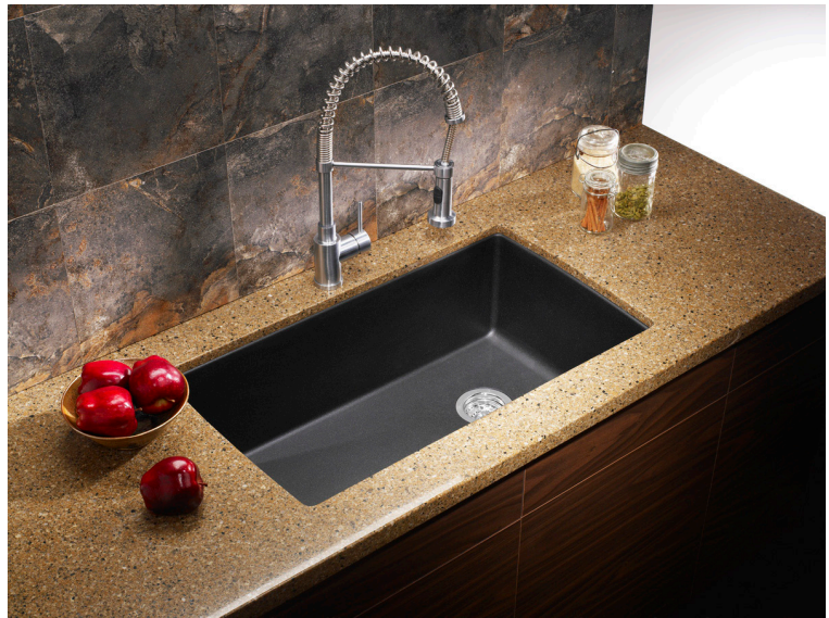
Monté sous plan dans l'image, attaches vendues séparément

Matériau composite ultra durable, le BLANCO SILGRANIT MD incorpore 80 % de granit naturel et un liant acrylique de haute qualité. Il offre une résistance et une durabilité inégalées.