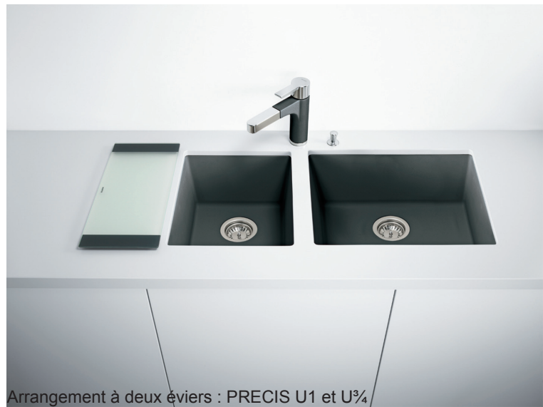
Arrangement à deux évier : PRECIS U1 et U 3/4

Matériau composite ultra durable, le BLANCO SILGRANIT MD incorpore 80 % de granit naturel et un liant acrylique de haute qualité. Il offre une résistance et une durabilité inégalées.